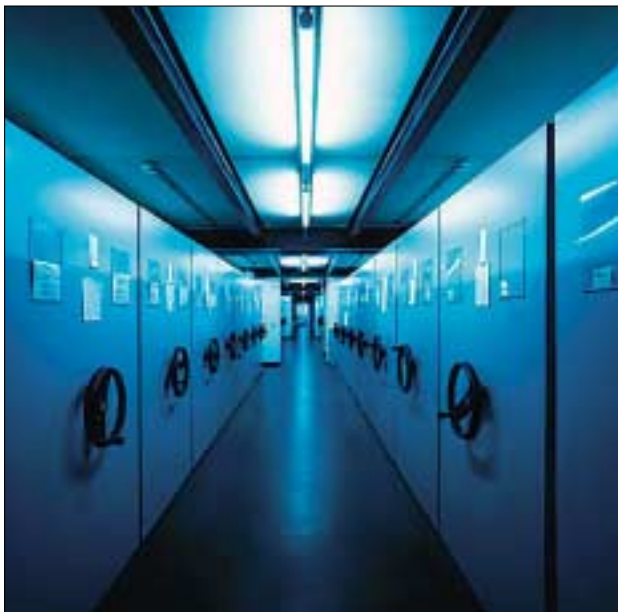
Depot Museum für Völkerkunde

Die Rechtsgrundlage für diese Mittel des BMBWK für die vollrechtsfähigen Bundesmuseen ist im §5 Abs. 5 BM-G geregelt. Es geht hier um größere Vorhaben, für die die Planungen bereits vor der Ausgliederung ange laufen sind und deren Umsetzungen erst Jahre später abzuschließen sind.