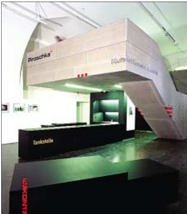
quartier21 – Themenstraße transeuropa

Die Renovierung und Adaptierung des barocken Fischer-von-Erlach-Traktes bildete den Schwerpunkt der Tätigkeiten im Jahr 2002. Eine Fläche von ca. 4.000 Quadratmetern wurde im September 2002 den neuen Mietern übergeben und wird seitdem von den mehr als 30 autonomen q21-Partnern bespielt. Das Erdgeschoß beherbergt Ausstellungsflächen, zwei multifunktionale Veranstaltungsräume, mehrere Shops sowie flexibel nutzbare Präsentations- und Arbeitsräume, die der Öffentlichkeit in Form von zwei durchgängigen Themenstraßen zugänglich sind. Im Obergeschoß des Traktes wurden 15 Kulturbüros realisiert. Weitere Räume des quartier21 befinden sich im so genannten Ovaltrakt. Hier stehen ab 2003 vier Gästezimmer, ein Print Center sowie weitere Flächen für kulturelle und kommerzielle Dienstleister zur Verfügung.