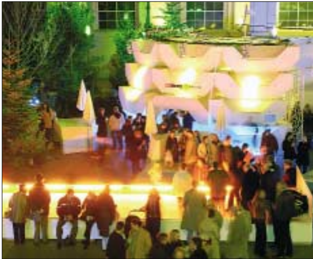
Veranstaltung im Winter

Mit einer Anfangsinvestition von rund € 2,9 Mio. und einem jährlichen Betriebsaufwand von rund € 1 Mio. wurde damit eine im internationalen Vergleich vollkommen neuartige Produktions- und Präsentationsfläche geschaffen.