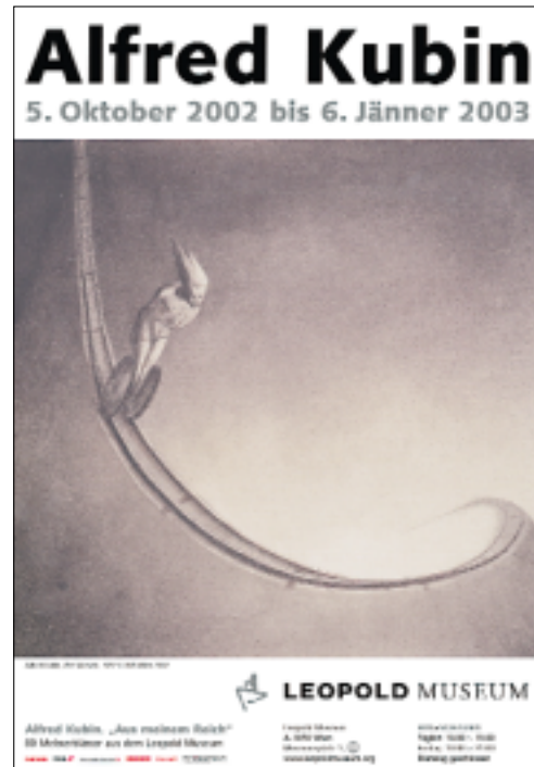
Poster zur Ausstellung Alfred Kubin „Aus meinem Reich“