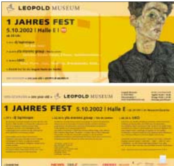
Folder 1 Jahres Fest

Museumsquartiers mit Dj Tapiresque, Yta Moreno Group, UKO on the decks (5.10.2002);