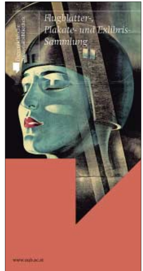
Die neuen Infolder: Flugblätter-, Plakate- und Exlibris-Sammlung

Durch die Vermietung ihrer historischen Räumlichkeiten an Unternehmen und internationale Veranstalter für Präsentationen, Symposien, Konferenzen etc. konnten wesentliche Einnahmen für die ÖNB lukriert werden.