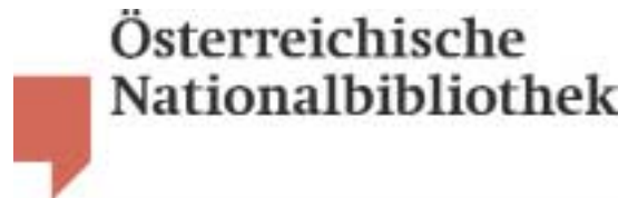
Das neue Logo der ÖNB

Mit der Neugestaltung des gesamten Corporate Designs der ÖNB sollte ein möglichst einheitliches, modernes und einprägsames Auftreten in der Öffentlichkeit geschaffen werden. Das neue Leitbild der ÖNB wurde bereits zu Jahresbeginn 2002 formuliert und veröffentlicht. Es ist der Versuch, zwischen den traditionellen Aufgaben einer Nationalbibliothek mit einer traditionsreichen, Jahrhunderte zurückreichenden Geschichte und den Möglichkeiten und Anforderungen eines modernen Informationszentrums zu einem neuen Selbstverständnis zu finden. Ausgehend von einem neuen zeitgemäßen Logo wurden alle wichtigen Drucksorten des Hauses neu gestaltet.