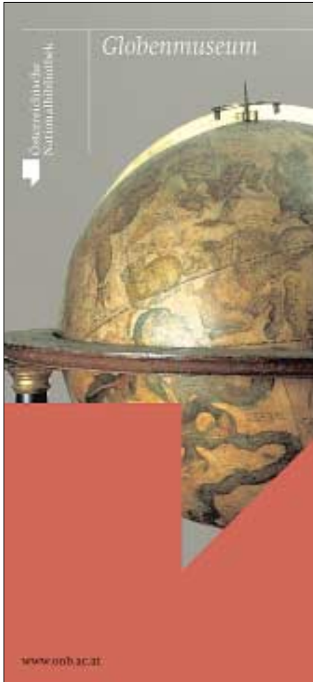
Die neuen Infofolder: Globenmuseum