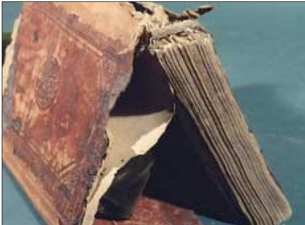
Codex aus der Sammlung Glaser vor der Restaurierung