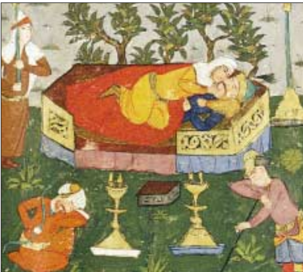
Ausstellung: „Der verbotene Blick“: Der Sassanidenkönig Ardashir mit seiner Geliebten aus dem Schabname des Firdausi, Persien 1616

Im Blickpunkt. Die Fotosammlung der Österreichischen Nationalbibliothek, Prunksaal (19. 11. 2002–26. 2. 2003)