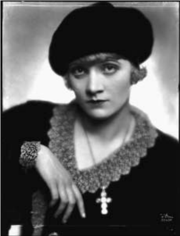
Ausstellung: „Der verbotene Blick“, Aufnahme von Marlene Dietrich aus dem Atelier d’Ora (Dora Kallmus)

Der verbotenen Blick. Erotisches aus zwei Jahrtausenden, (17. 5.–31. 12. 2002)