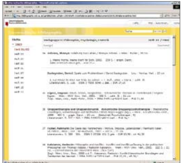
Die Österreichische Bibliographie online

( http://bibliographie.onb.ac.at/biblio/ )