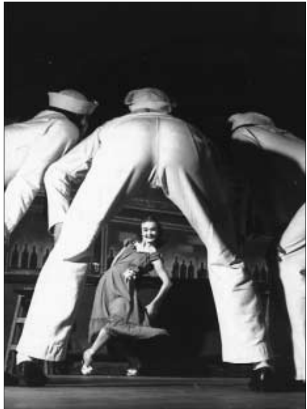
Ausstellung: „Im Blickpunkt“: American Ballet Theatre in „Fancy Free“, Wien 1953

Im Blickpunkt. Die Fotosammlung der Österreichischen Nationalbibliothek, Prunksaal (19. 11. 2002–26. 2. 2003)