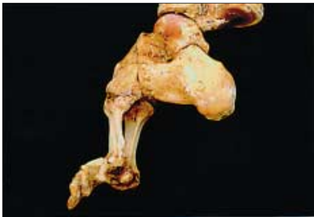
Fußskelett nach künstlicher Deformation aus China aus der Sammlung des Instituts für Anatomie