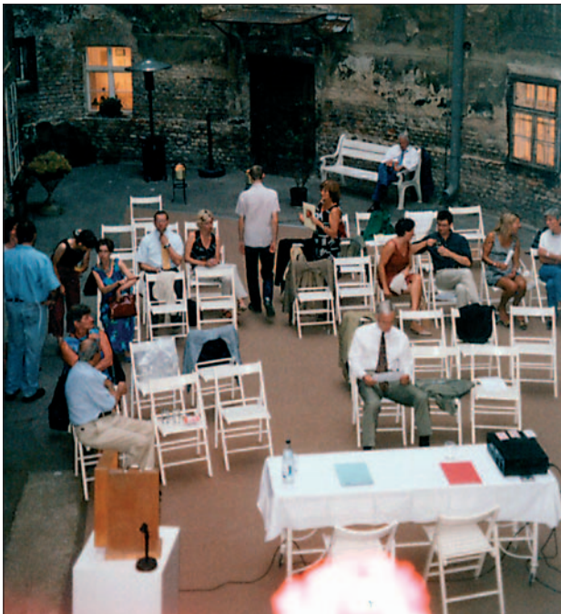
Sommerversammlung „Lesung – Morbus Viennensis“