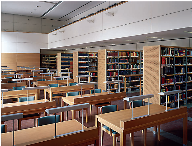
Neu gestalteter Hauptlesesaal

Am 6. 9. 2004 eröffnete die ÖNB den generalsanierten Benützungsbereich am Heldenplatz mit einem großen Fest. Die vollständige Neugestaltung des Haupt- und Zeitschriftenlesesaals, des Eingangsbereichs (Service-desk), der neuen Leselounge und der Sanitäranlagen zielte wesentlich auf funktionale Verbesserungen ab, sollte aber auch eine zeitlos klassische, ruhige Atmosphäre schaffen. In den Lesesälen wurde eine Klima- und Luftbefeuchtungsanlage installiert, die komplette Einrichtung erneuert und ein neuer Lift zum Zeitschriftenlesesaal eingebaut, der zusammen mit dem Behindertenlift beim Eingang einen durchgehend