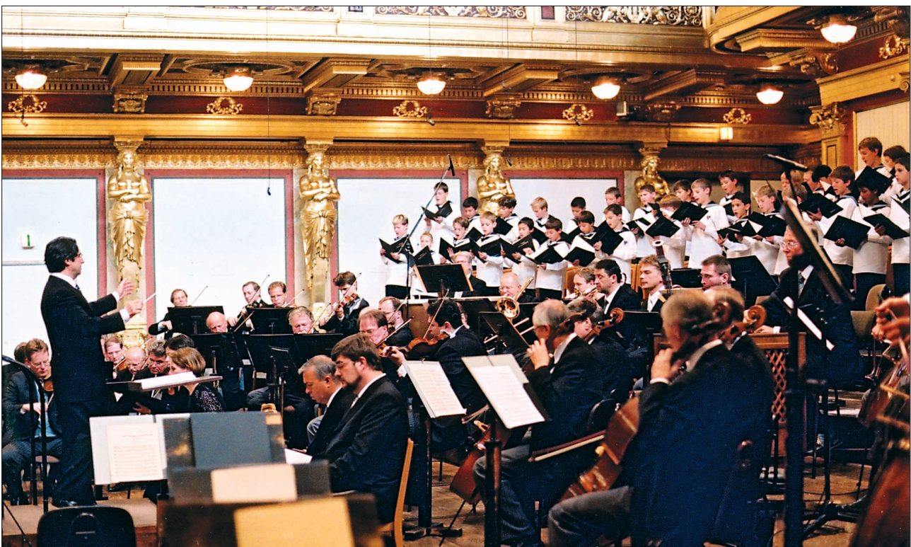
Konzertanter Auftritt der Hofmusikkapelle