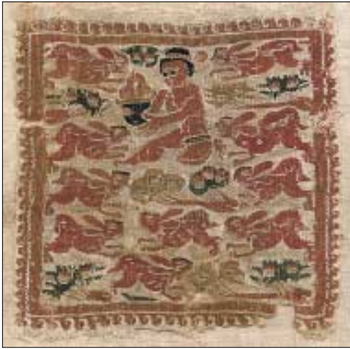
Neuerwerbung Papyrussammlung: Tabula mit Korbtägerin

einzelne florale Motive eingebettet ist. Eingerahmt wird die Szene vom wellenförmigen Motiv des laufenden Hundes. Damit konnten die Textilbestände der Papyrusammlung um ein einzigartiges Stück erweitert werden.