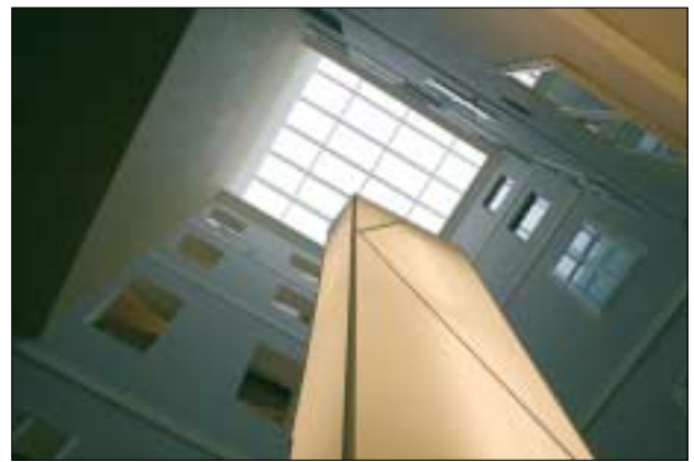
Palais Mollard, Hof

Mit der Fertigstellung und feierlichen Eröffnung des neuen Standorts im Palais Mollard ist für die ÖNB nach zweieinhalb Jahren Bauzeit im November 2005 ein wichtiges und großes Bauprojekt erfolgreich abgeschlossen worden. Es bringt die wohl bedeutendste räumliche Erweiterung seit dem Bau des Burggarten-Tiefspeichers 1992. Die Musiksammlung eröffnete ihren Lesesaal am 14. 11. 2005, nachdem zuvor schon drei Musiksalons in den neuen Veranstaltungsräumen im zweiten Obergeschoß stattgefunden hatten. Das Globenmuseum und das Esperantomuseum öffneten am 1. 12. 2005 ihre ganz neu gestalteten Ausstellungsräume für das Publikum.