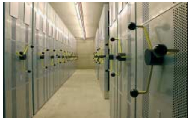
Palais Mollard, Speicher

Im Zuge der Generalsanierung des Bildarchivs wurde die Absiedelung der gesamten Sammlung im März/April dieses Jahres notwendig. Die neu geschaffenen Magazinräume im Dachbodenbereich konnten bereits fertig gestellt und vom Bildarchiv bezogen werden. Die Bauarbeiten in der Sammlung sind im Gang und sollen bis Herbst 2006 abgeschlossen sein.