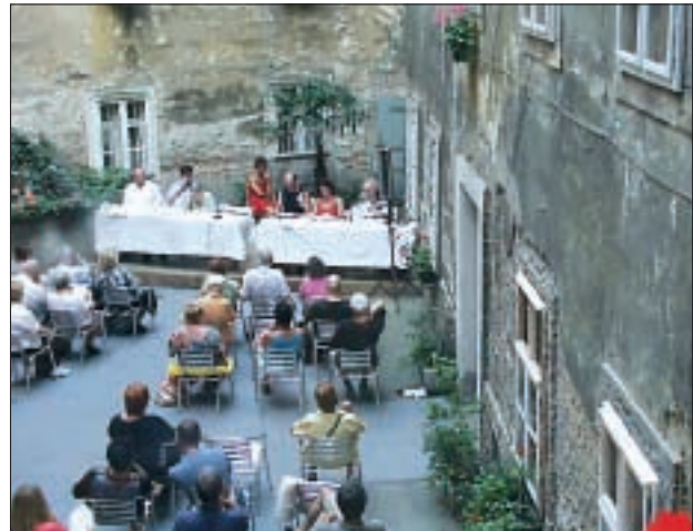
Erstes Wiener Lesetheater

Im pathologisch-anatomischen Bundesmuseum finden regelmäßig Präparatepräsentationen statt. Wie zum Beispiel für die Volkshochschule Alsergrund, Polycollege und die Wiener Sozialdienste – Alten- und Krankenpflege.