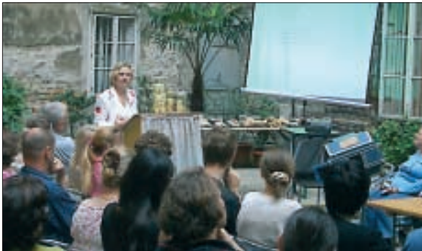
Vortrag „Die Narrenturm-Sammlung“