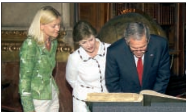
Der Präsident der Vereinigten Staaten mit Gattin zu Besuch in der ÖNB