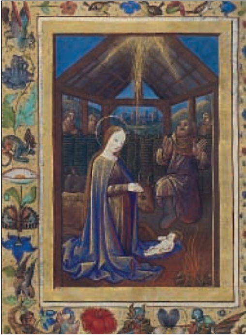
Ausstellung „Christ ist geboren“. Prachthandschriften

Christ ist geboren. Prachthandschriften zum Weihnachtsfest. Prunksaal (1. 12. 2006–14. 1. 2007)