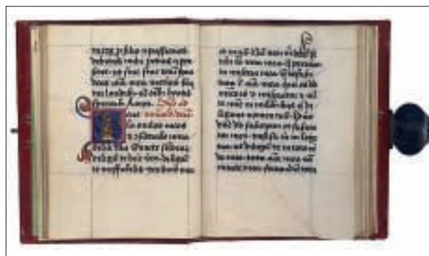
Neuerwerbung: Das Gebetbuch von Kaiser Friedrich III.

2005 wurde vom Institut für Restaurierung ein Masterplan bezüglich notwendiger Bestandserhaltungsmaßnahmen für alle Sammlungen der ÖNB vorgelegt. Dieser Plan wird in den nächsten Jahren nach festgelegten Prioritäten und personellen Ressourcen schrittweise umgesetzt.