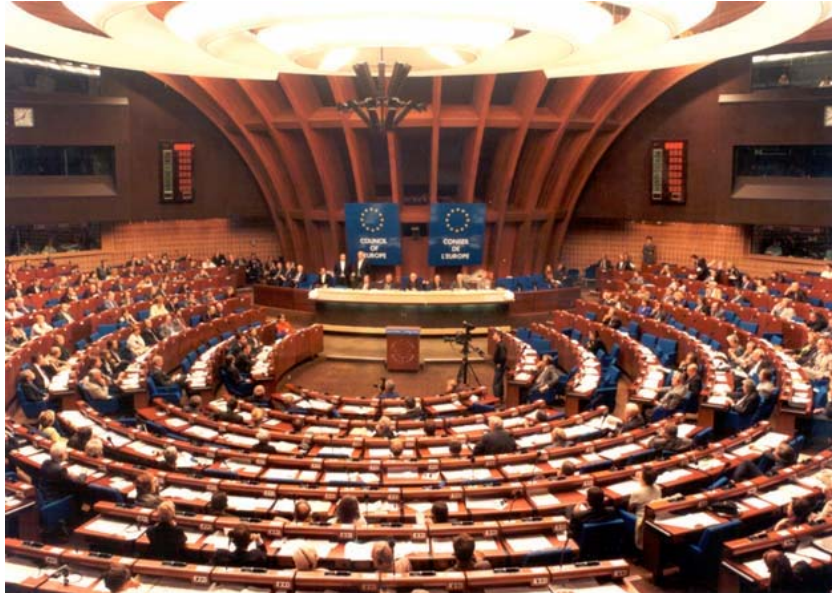
Sitzungssaal der "Parlamentarischen Versammlung des Europarates"