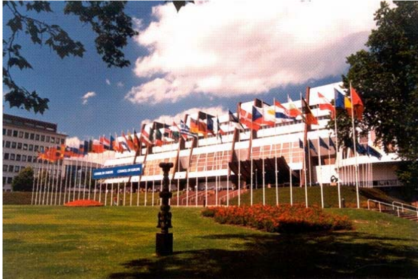
Frontansicht des „Palais de l'Europe“