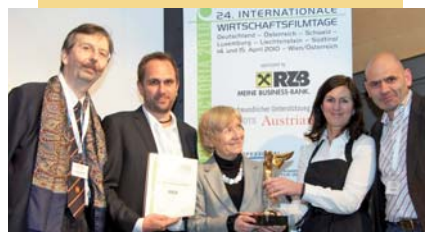
Kategorie Aus-, Weiter- und Berufsbildung: „Meine Schule – Die berufsbildenden Schulen Österreichs“, Produzent Kubefilm GmbH