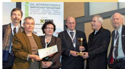
Kategorie Technologie, Forschung und Entwicklung, Umwelt: „Das Gehirn“, Produzent Gerald Kargl GmbH

Alle Filme können von Schulen über das Medienservice des BMUKK bezogen werden: www.bmukk.gv.at/medienservice