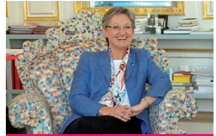
Dr. Claudia Schmied Bundesministerin für Unterricht, Kunst und Kultur

CLAUDIA SCHMIED: Richtig. Das Mentoring-Programm von Frauen für Frauen haben wir im Jänner 2011 als Pilotprojekt gestartet. Erfahrene, etablierte Künstlerinnen, Kuratorinnen und Expertinnen begleiten ein Jahr lang junge Künstlerinnen.